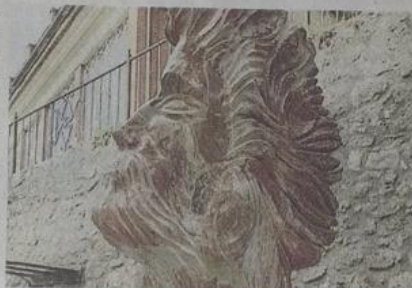
La scultura in marmo ispirata al dio Nettuno

Una rappresentazione scultorea del dio Nettuno, in marmo policromo di Vitulano, è in esposizione permanente a Procida, proclamata «Capitale italiana della cultura 2022». Anche il Comune vitulanese, in tal modo, asurge idealmente a simbolica «Capitale artistica» del prossimo anno. Questa suggestiva opera marmorea dell'antica divinità dell'ambiente marino è stata scolpita dal 73enne scultore Mariano Goglia, nato e residente da sempre a Vitulano, dove fra l'altro è l'ideatore, in sinergia con il