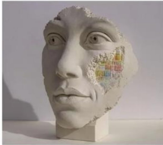
Salvatore Alibrio, Frammento di Procida

Scultura a tutto tondo in pietra bianca di Palazzolo Acreide e colori a pastello, 40 cm x 31 cm x 16 cm, anno 2021.